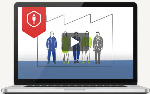
für Videolink auf Bild klicken

Erfahren Sie hier in unserer Broschüre mehr zur Durchführung der Gefährdungsbeurteilung psychischer Belastungen, wie Sie die GBpsych in Ihrem Unternehmen umsetzen und wie wir Sie hierbei unterstützen können. Schauen Sie sich dazu auch gerne das folgende Video an: